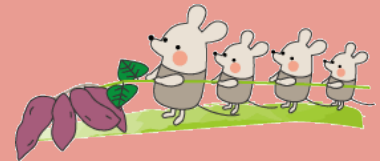
11月はサツマイモほりするよ