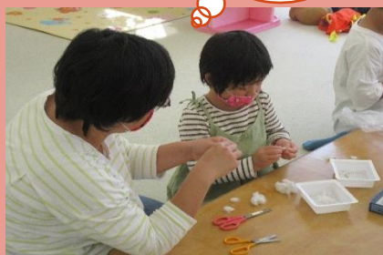
とれた綿で11月にリースをつくるよ😊