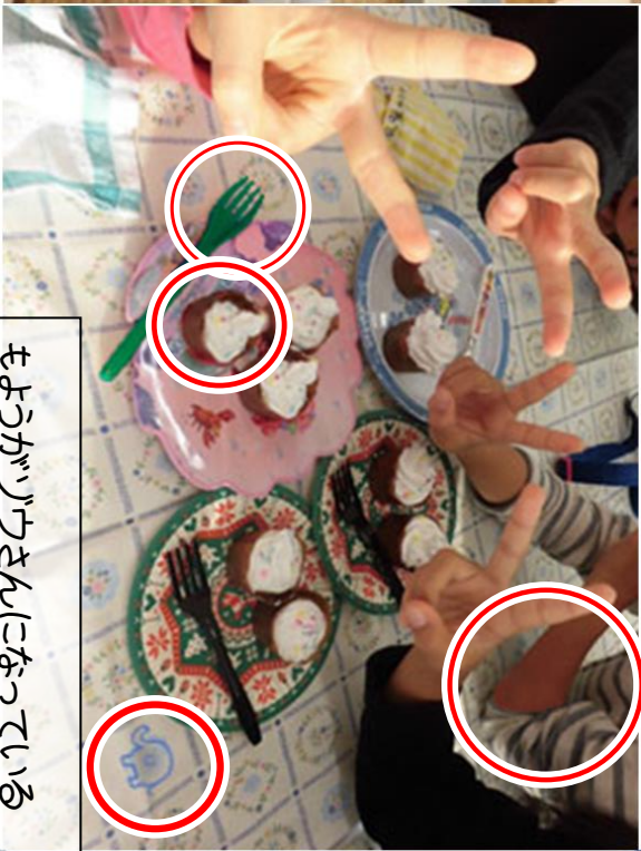
そでがすこし短い(難易度高め)