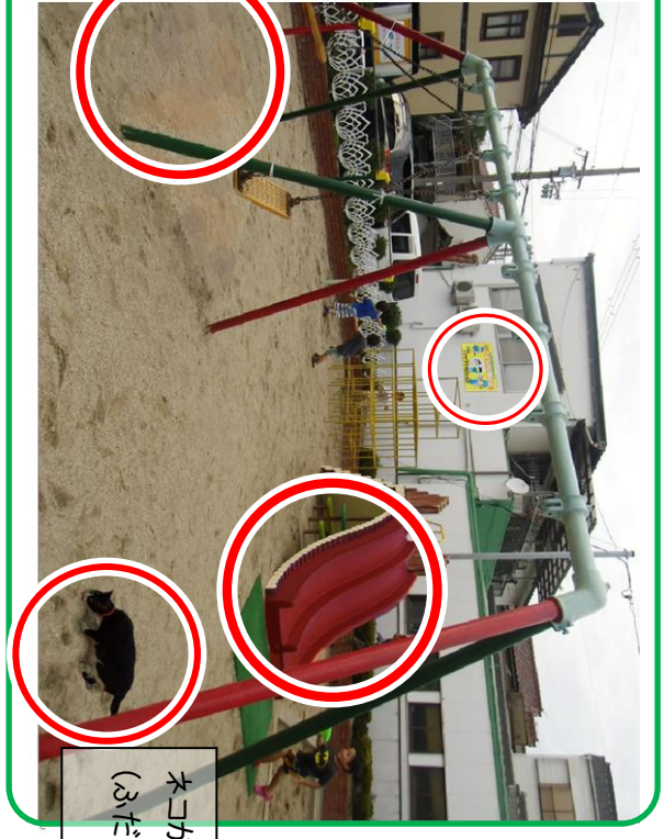
ネコがあらわれた (ふだんはいません)