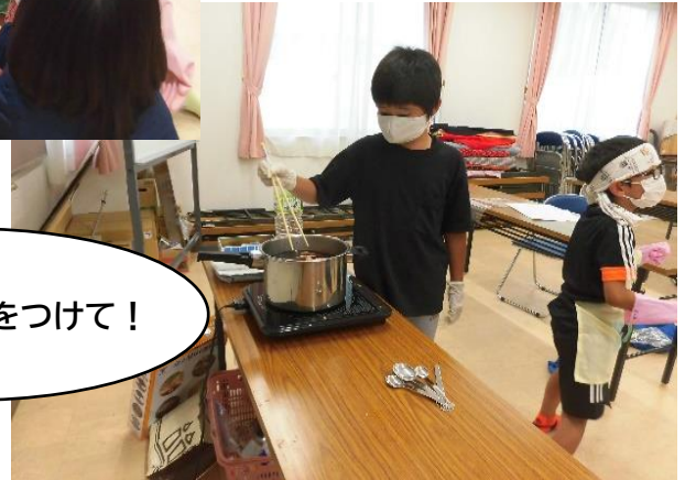
ゆっくり丁寧に染めます