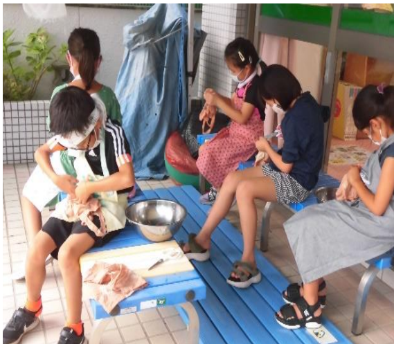
布を切らないように慎重に輪ゴムを切ります