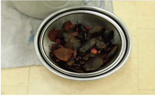
アボカドの皮とタネで染めます