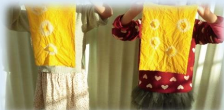
ステキな模様の 世界に一つのオリジナルバッグの 完成です!