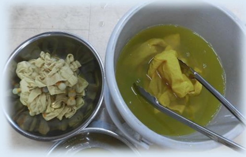
みんなで話し合って今回は「後媒染(あとばいせん)」という方法を選びました なかなか染まりにくいですが、色落ちしにくくなります