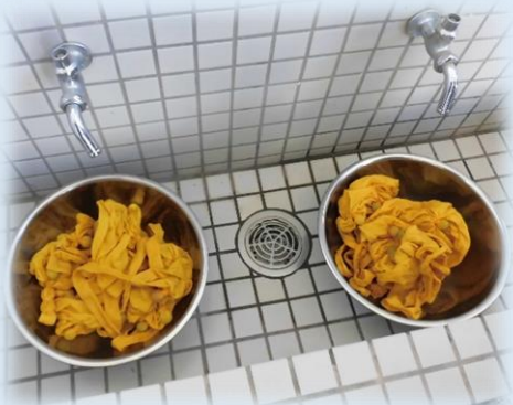
とてもいい色に染まりました