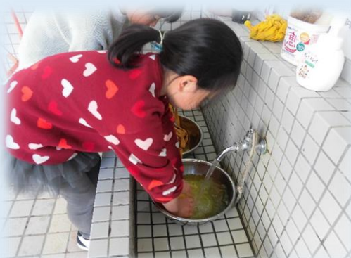
余分な染料をすすぎます