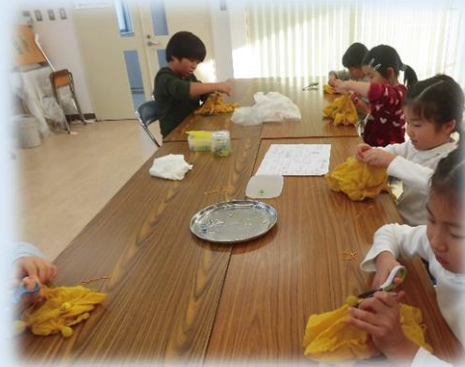
輪ゴムを切る作業です 緊張の一瞬! 上手く模様ができただかな?