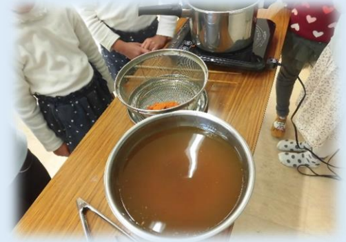
乾燥させたマリーゴールドの花びらを30分煮出すと染液の完成です