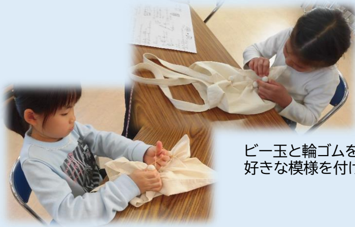
ビー玉と輪ゴムを使って好きな模様を付けます