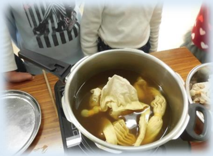
布を染液に浸して30分煮ます