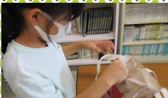
一気にひっくり返す！