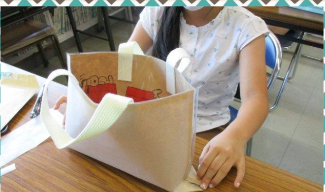
バックのマチを作って…