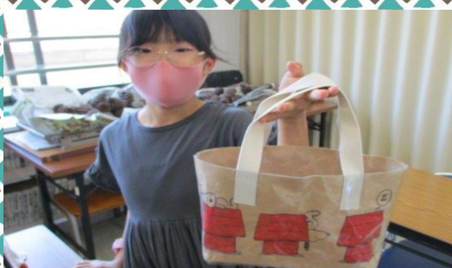
形を整えて！ 出来上がり♪