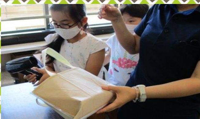
ドライヤーで温めて…