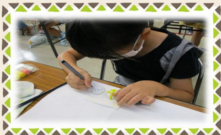
マジックペンで顔を書きます。