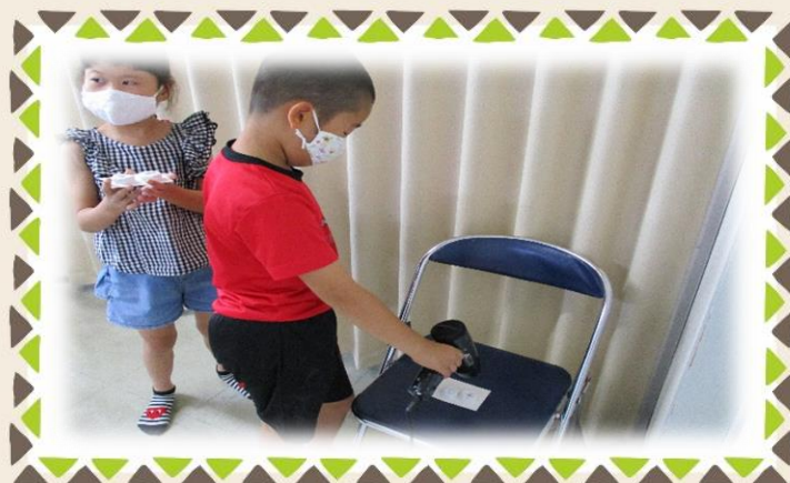
ドライヤーで乾かします。