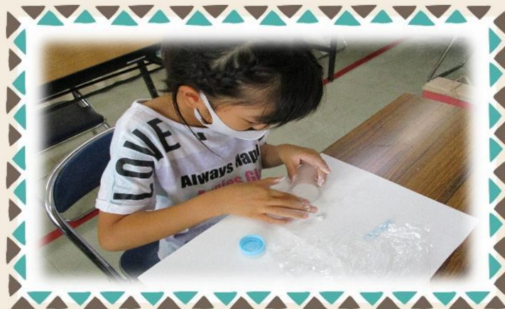
丸く形を作っていきます。