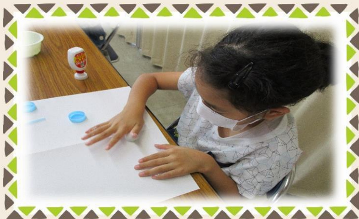
説明を聞いた後、粘土をこねます。