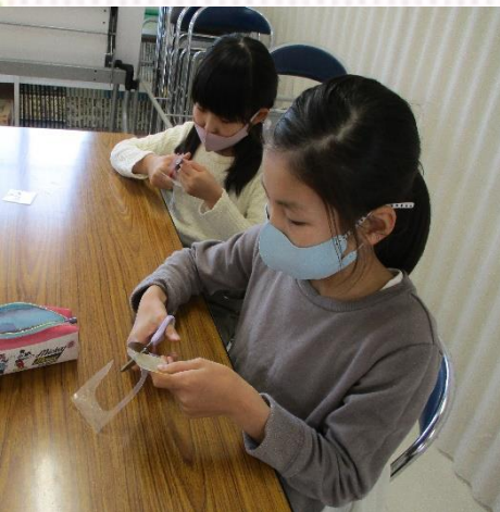
好きな形に切るよ。