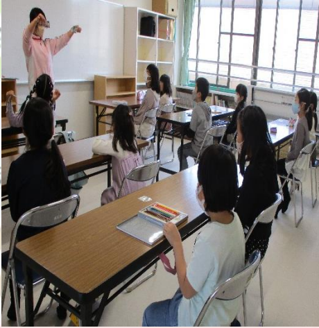
説明を聞いて、作業開始です！