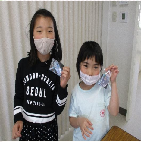
金具とビーズをつけて出来上がり。