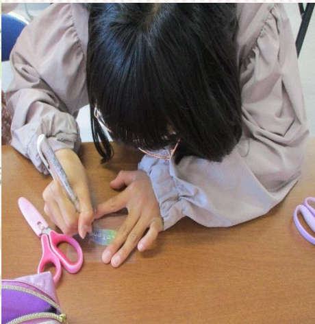
白ペンで名前を書くよ。