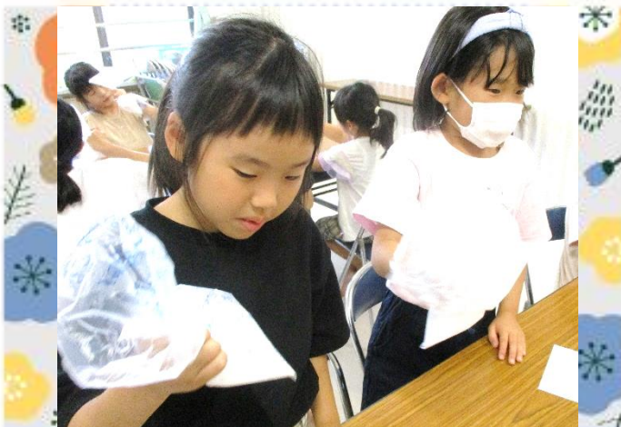
混ぜて！混ぜて！混ぜて！