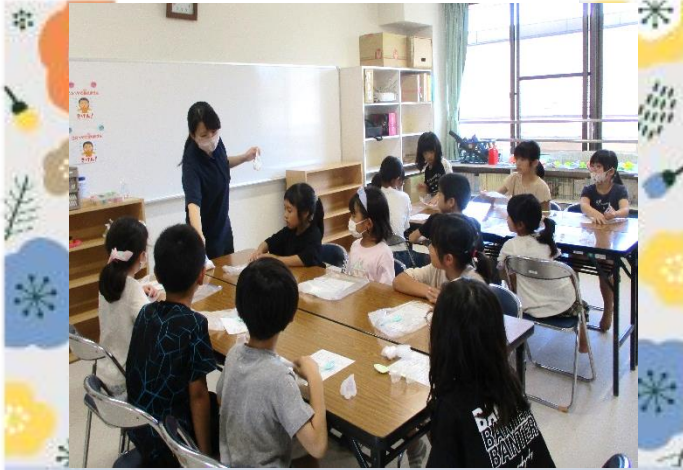
説明を聞いて、作業開始！