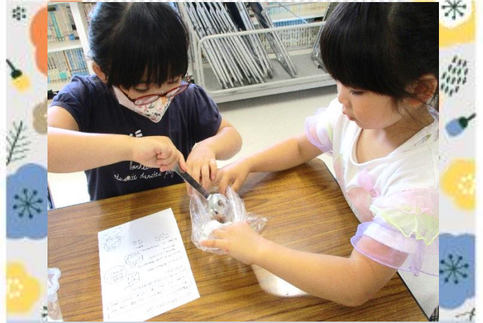
重曹、クエン酸の必要な量は・・・？