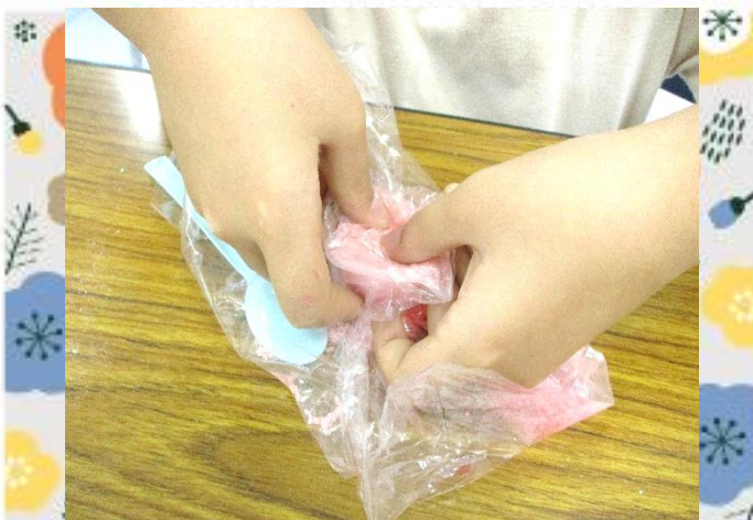
ギュッギュッと詰めて・・・