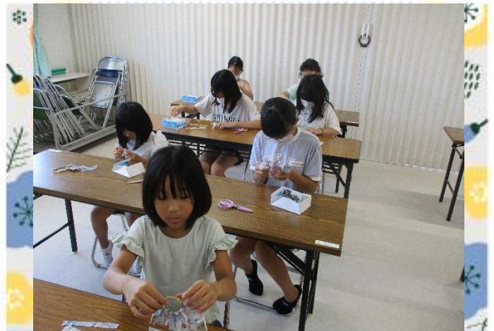
みんな集中力すごい！