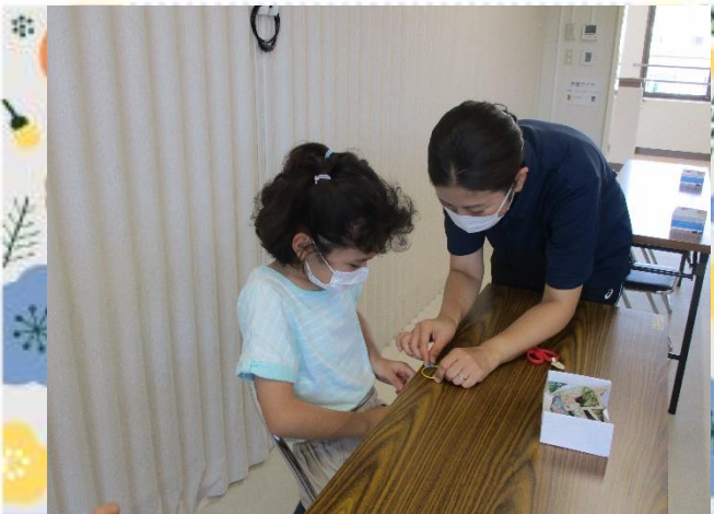
次の順番どれかな？