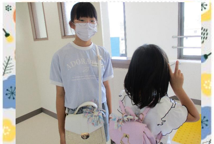
かばんに早速つけてみたよ！