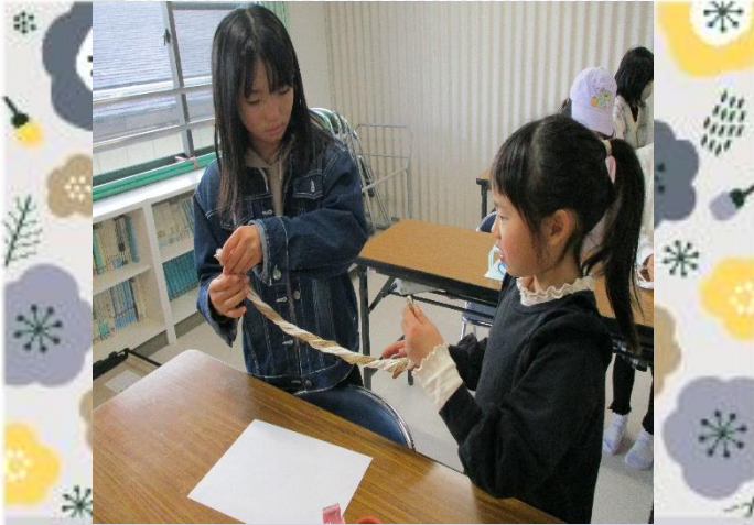
縄をふたりに編みます