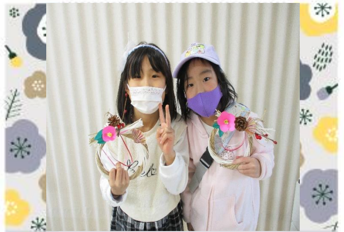
お正月、お家で飾ってね