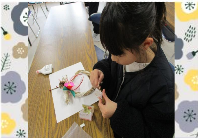
最後に扇を貼り付けます