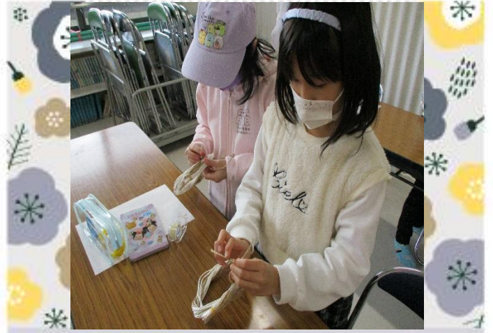
それぞれ輪にします