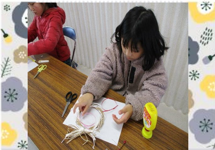
しめなわの形が出来ました